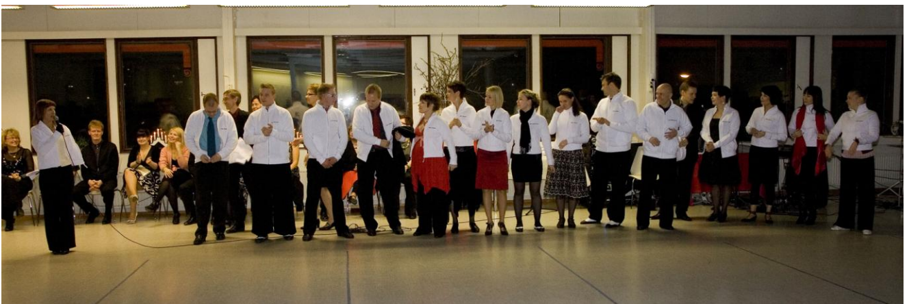
Ohjaajien takkien jako