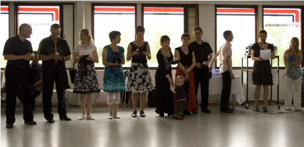
Kevätkauden päättäjäiset, ohjaajia