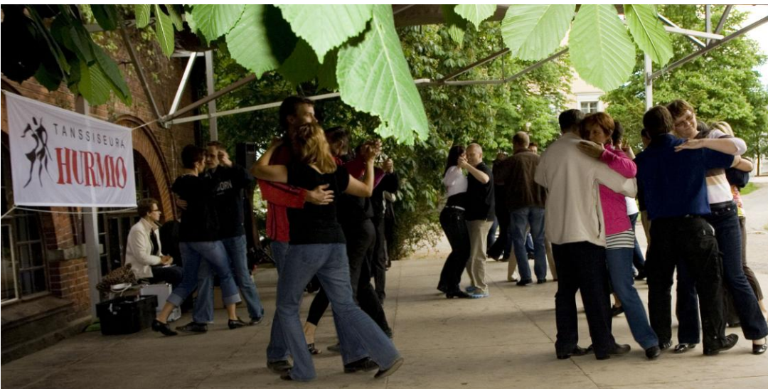
Kaupunkitanssit Vanhan Kirjastotalon puiston lavalla