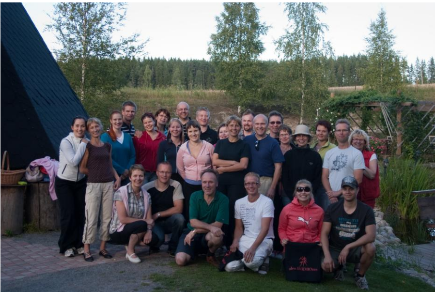
Virkistystilaisuus Rudolfin Keitaalla