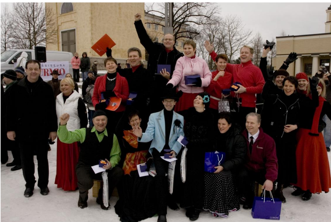
Lumitangon MM -finalistit