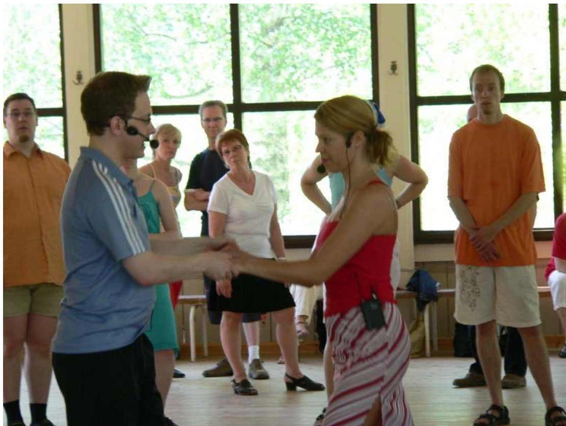
Kuva 2 Hurmiotanssit Viikinsaarella 17.6.2006