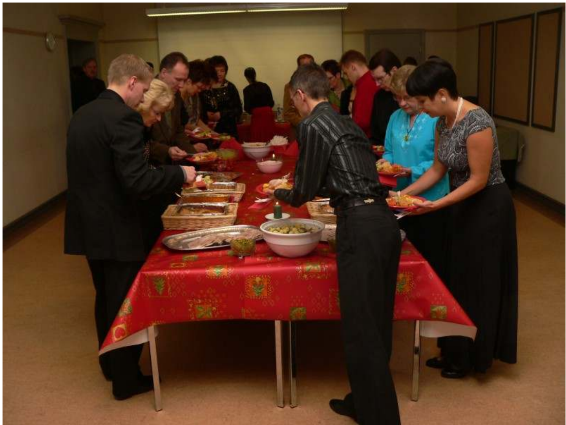
Kuva 6 Pikkujoulut 17.12.2006 Nokian Kerholassa