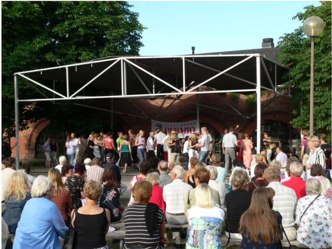
Kuva 3 Lavatanssit vanhan kirjaston lavalla 28.7.2006