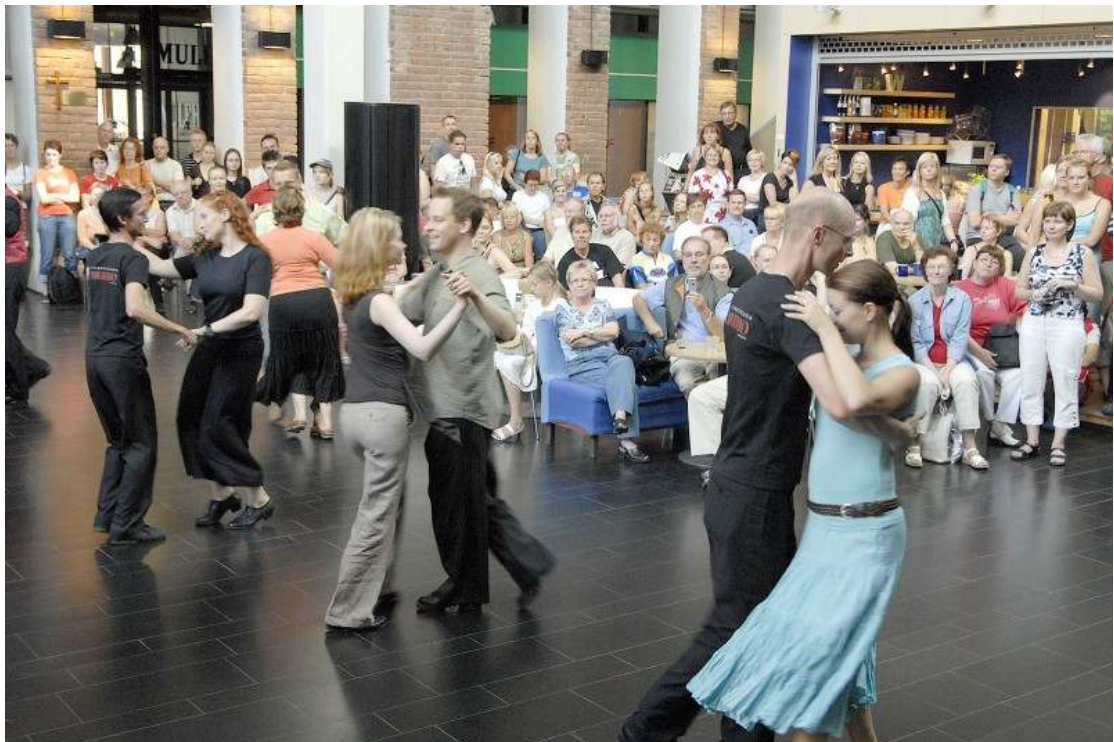
Kuva 4 Esittelytilaisuus 26.8.2006 Siperiassa