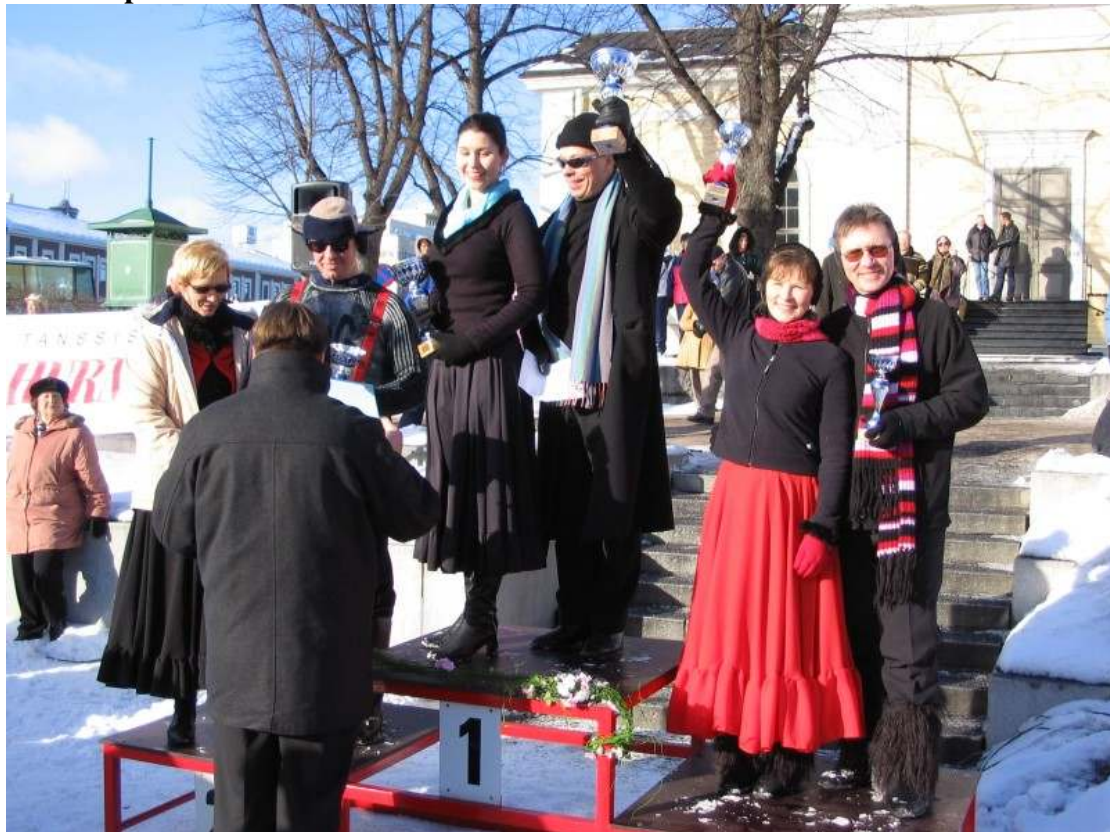
Kuva 1 Lumitangon MM-kilpailujen palkitut 25.2.2006